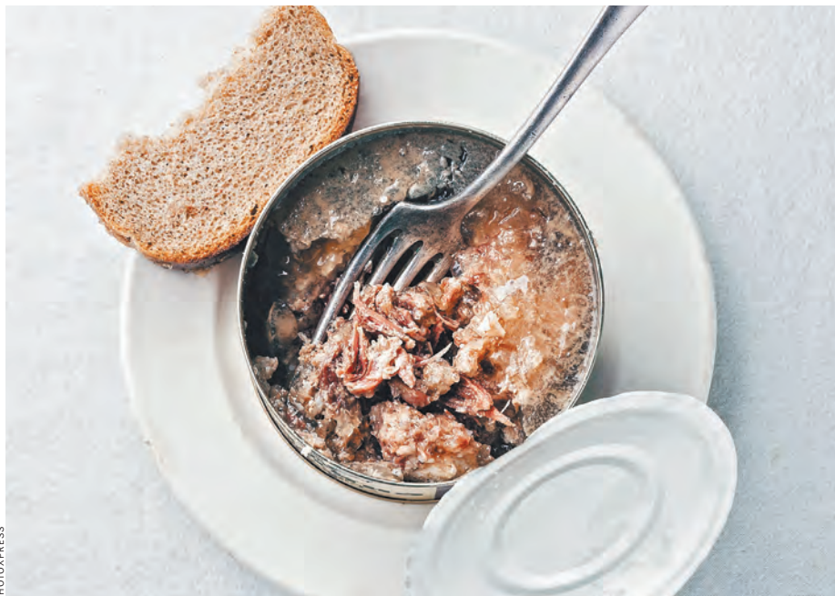
Во время дефицита 90-х резервы обеспечивали до половины продовольственной корзины дотационных регионов, что позволило избежать настоящей катастрофы.

ПРАВО Минюст предлагает расширить доступ правозащитников в тюрьмы