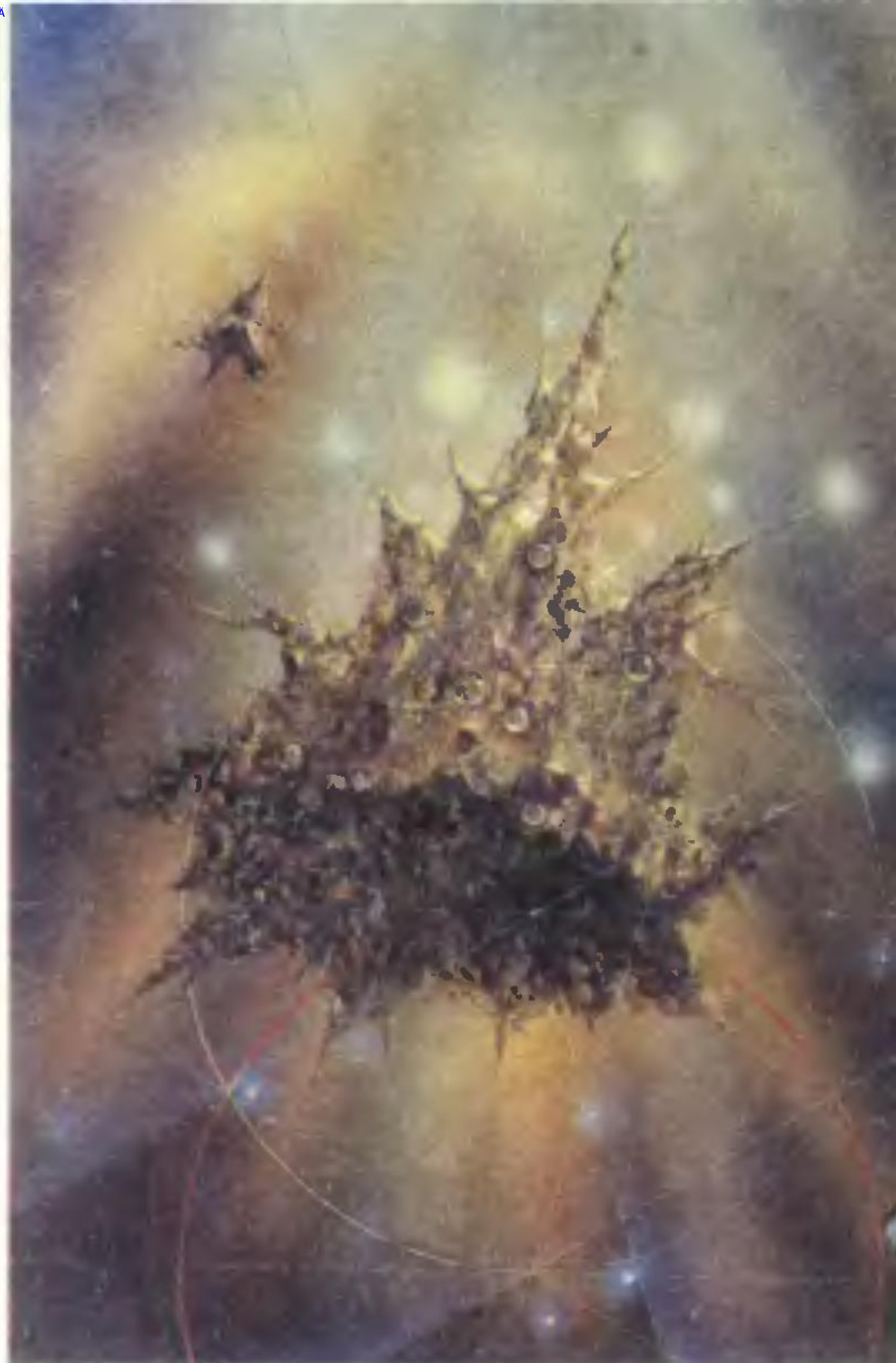
В. Тихомиров. «Парад планет», 1991 год