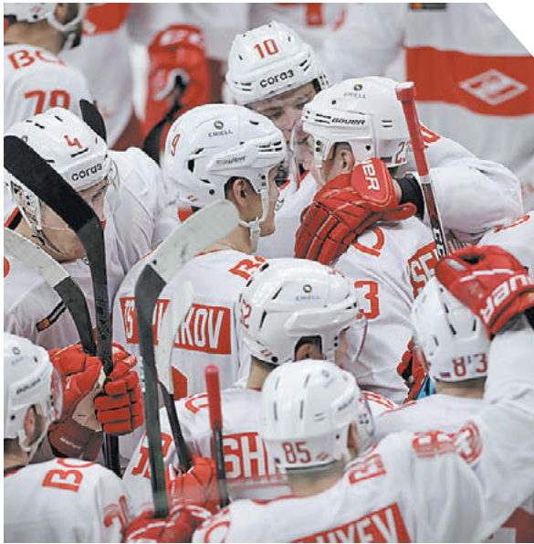
Александр Федоров «СЭ» / Canon EOS-1DX Mark II