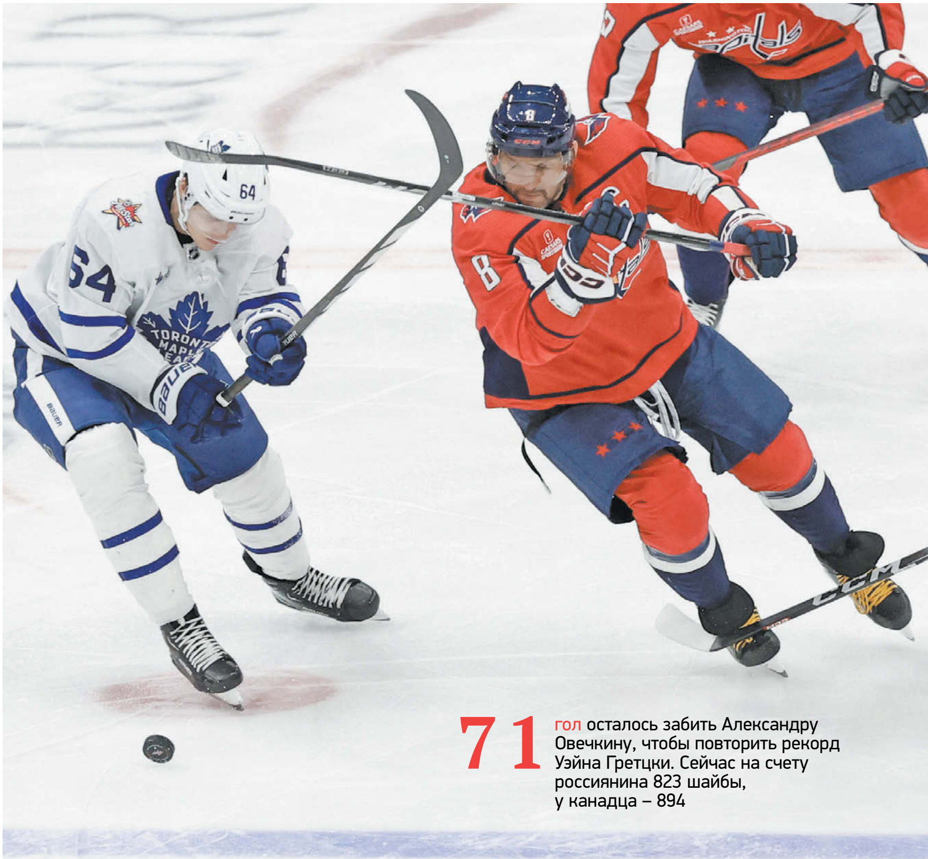
Вчера. Вашингтон. «Вашингтон» – «Торонто» – 1:4. В атаке – Александр Овечкин (справа)

Вчера Александр Великий прервал свою четырехматчевую безголевую серию, поразив ворота «Торонто». Однако эта шайба никак не помогла его команде, безнадежно уступившей – 1:4