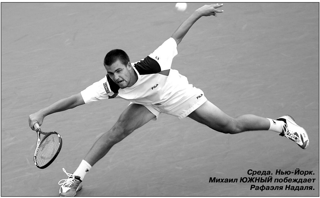
Среда. Нью-Йорк. Михаил ЮЖНЫЙ побеждает Рафаэля Надаля.