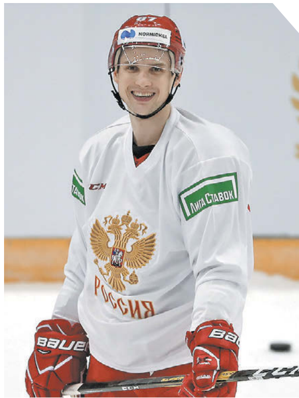
Александр Федоров «СЗ» / Canon EOS-1DX Mark II