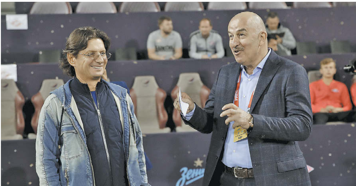
Владелец «Спартака» Леонид Федун (слева) и главный тренер сборной России Станислав Черчесов