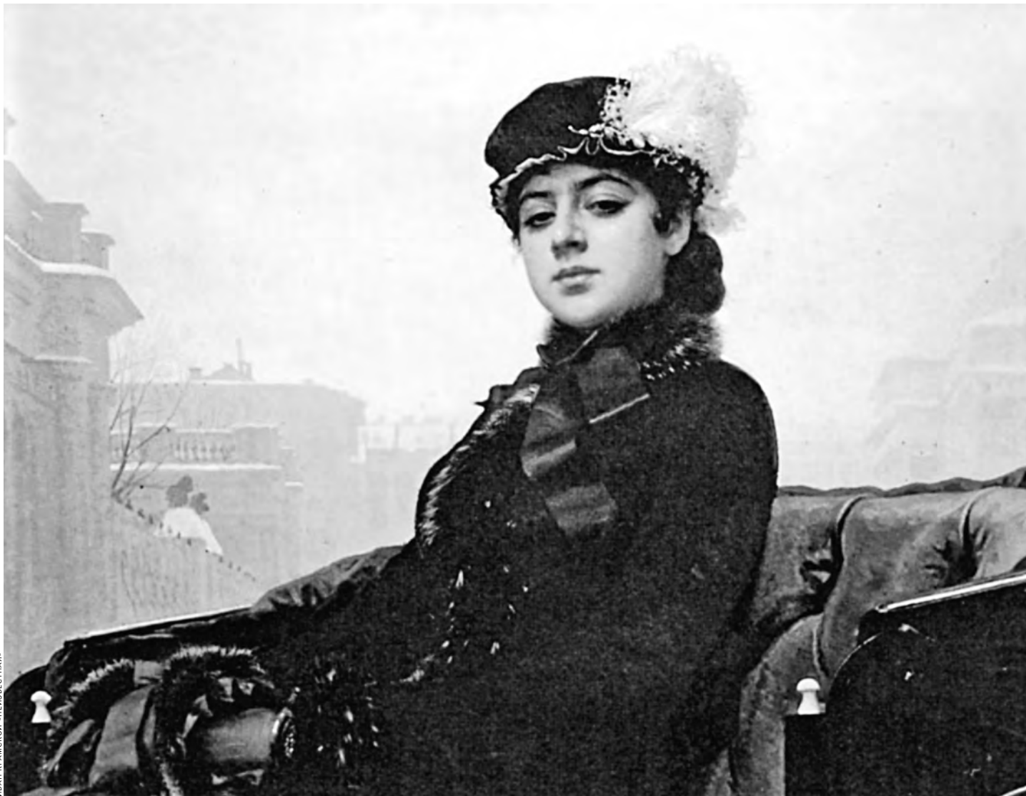
«Неизвестная» Ивана Крамского стала одной из самых известных его картин.

ЗЕЛЬФИРА ТРЕГУЛОВА: Я всю свою творческую биографию работала с Третьяковской галереей начиная с 1988 года. Сегодня залог успеха любого мирового музея — комфорт посетителей самого разного уровня. От входной зоны до дизайна экспозиции и возможности отдохнуть внутри музея... Третьяковка в последние годы показала, что здесь делают сложные и интересные проекты, для которых собираются экспонаты и из музеев России, и из многих зарубежных коллекций.