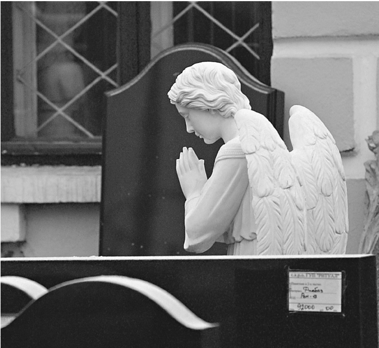
ФАС борется с необоснованными накрутками цен на ритуальные услуги