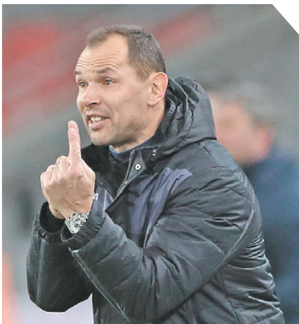
Александр Федоров «СЗ». Снято на Canon