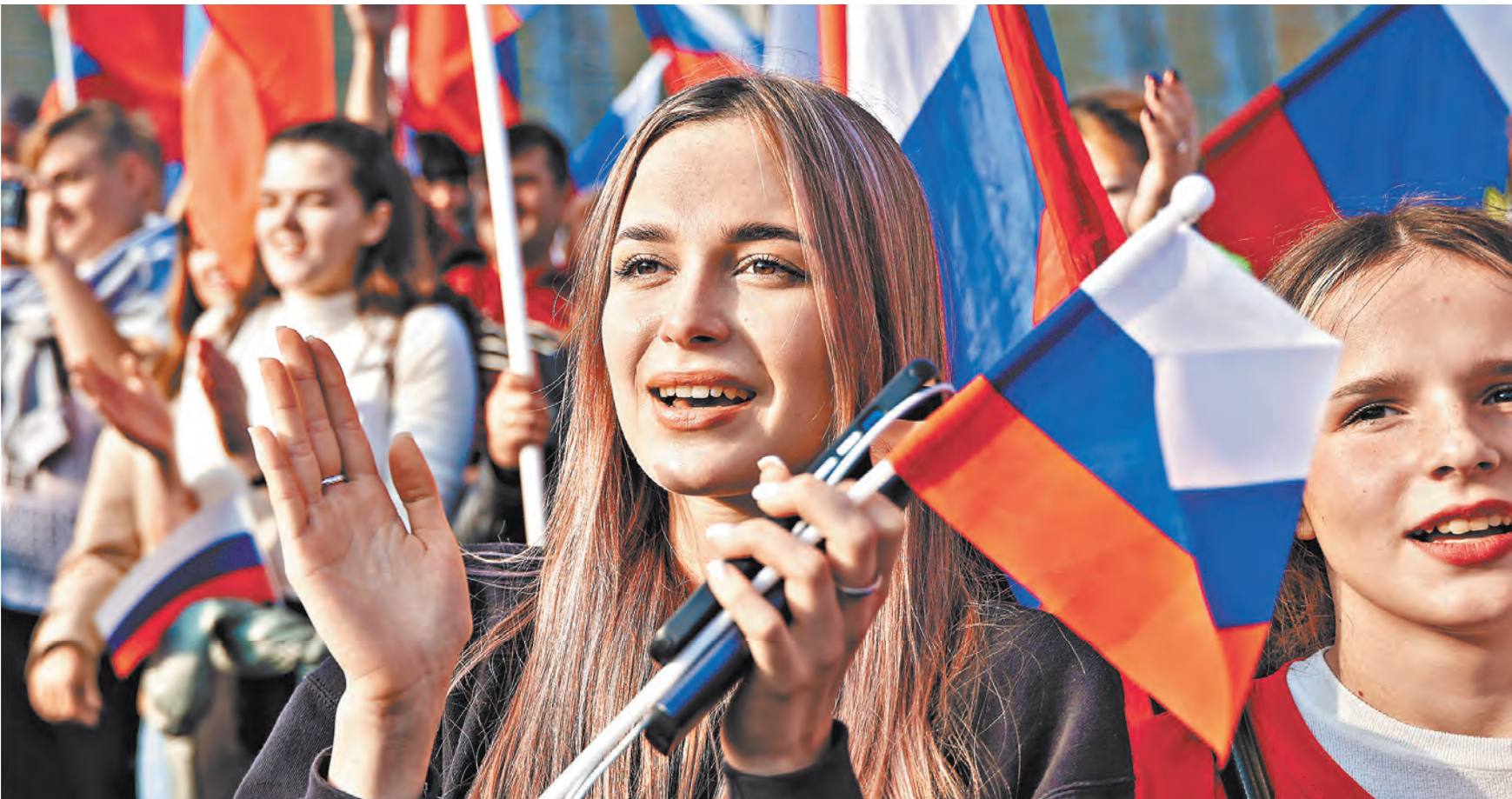
«За выбором миллионов жителей в Донецкой и Луганской народных республиках, в Запорожской и Херсонской областях — наша общая судьба и тысячелетняя история», — заявил Владимир Путин на церемонии подписания договоров.

Сегодня «Российская газета» публикует эти документы и дает ответы на главные вопросы, связанные с процессом интеграции.