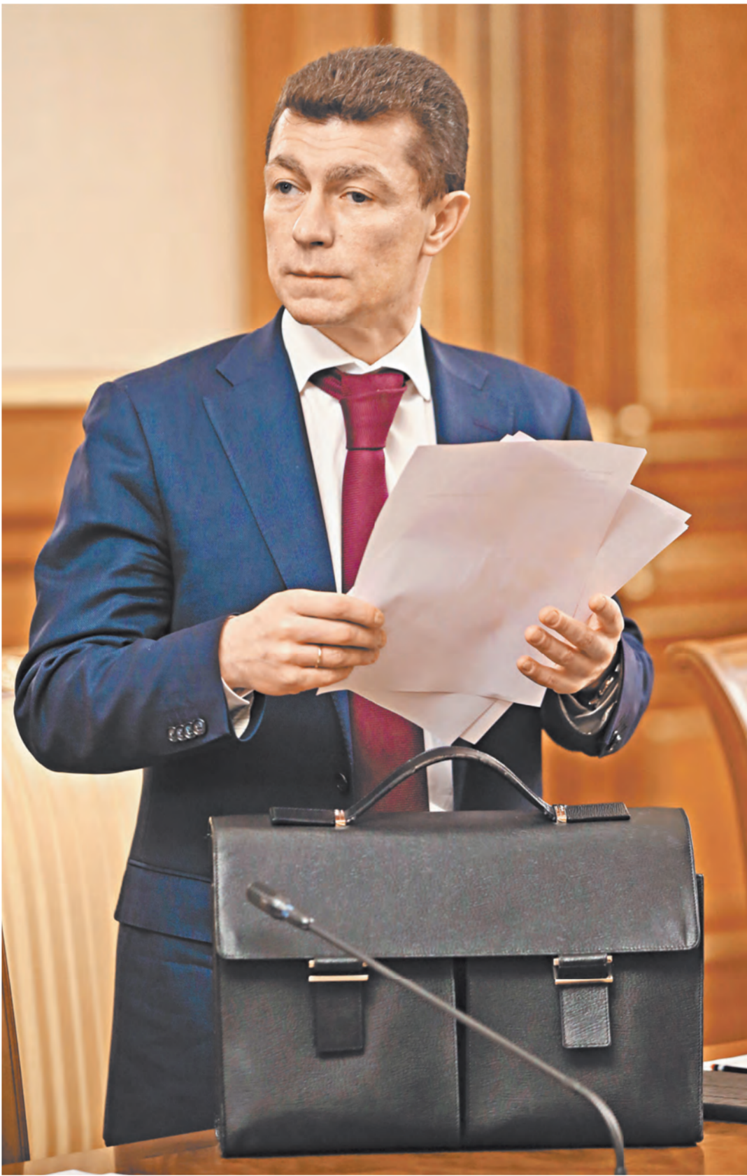
Максим Топилин: В продовольственной корзине слишком много хлеба, надо добавить мяса и рыбы.

Этого нельзя допускать. Но, конечно, перекрыть суммарный коэффициент рождаемости 30-процентное снижение количества женщин — это из области фантастики. А значит, меры поддержки семей должны каждые три-четыре года трансформироваться и прибавляться.