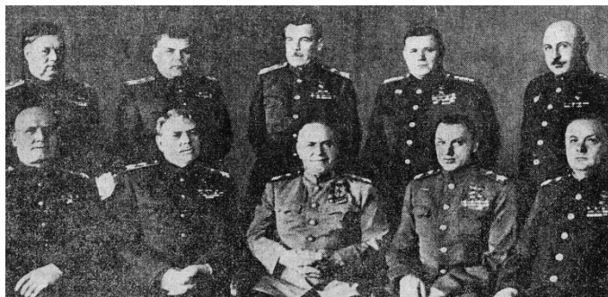
Командующие войсками фронтов на заключительном этапе Великой Отечественной войны. Сидят: И. С. Конев, А. М. Василевский, Г. К. Жуков, К. К. Рокоссовский, К. А. Мерецков. Стоят: Ф. И. Толбухин, Р. Я. Малиновский, Л. А. Говоров, А. Н. Еременко, И. Х. Баграмян. Фото 1945 года.

выходили за пределы компетенции фронта и были связаны с необходимой помощью фронту со стороны Ставки Верховного Главнокомандования.