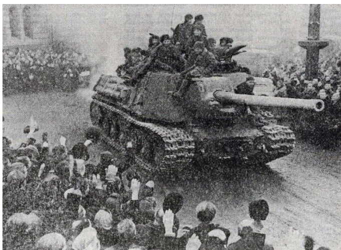
Снимок из архива. 1945 год. Советские войска входят в освобожденный польский город Лодзь. Виктор Темин

40 лет назад Совинформбюро сообщило: На безымянной высоте