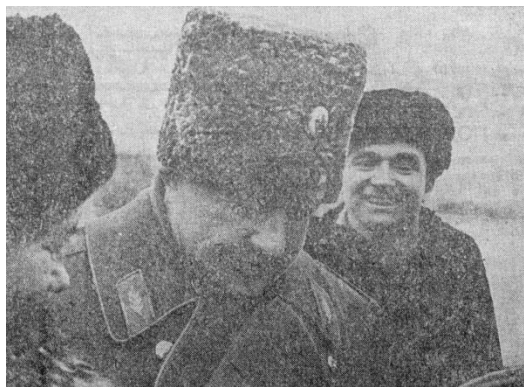
НА СНИМКЕ: генерал-полковник А. И. Родимцев дает автографы участникам обороны Сталинграда. 1973 год.

Вдоль берега, по всему расположению дивизии, тянулись землянки и блиндажи, пронумерованные, как дома. В них располагались штаб, политотдел, передовой пункт медсанбата. Узкая полоска берега была действительно похожа на улицу. И гвардейцы называли ее «улицей Родимцева». Понятно, что официально это название не утверждалось. Возникло оно стихийно, как дань уважения и любви к своему комдиву... Знал ли генерал об этом? Ни утверждать, ни отрицать не берусь. Но он любил поздним вечером в тихие минуты прогуляться по «своей улице». Отдыхал, обдумывал. Кое-где из приоткрытой двери мелькнет огонек, змейкой взметнется над землянкой или блиндажом сизый дымок самодельной печки. Транссирующие пули светлячками мелькают в вышине и гаснут где-то над Волгой.