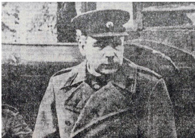
Командующий Ленинградским фронтом генерал-полковник Л. А. Говоров (1943 год).