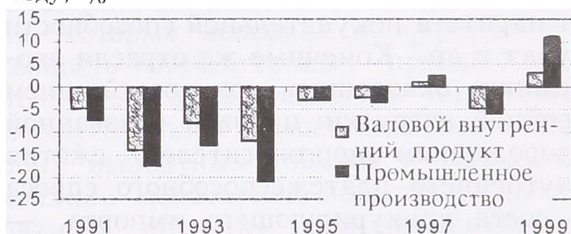
Р и с. 1. Динамика основных макроэкономических показателей

1992 — 1994 гг. — обвальный кризис, сопровождаемый крутым и безостановочным падением ВВП и промышленного производства;