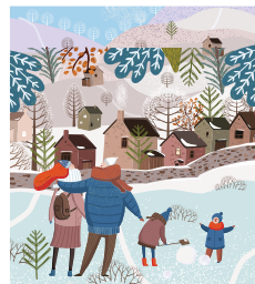
Рисунок на обложке: Shutterstock.com