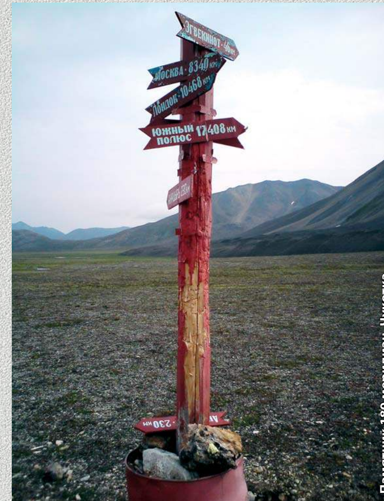
Памятник 180 меридиан. Чукотка