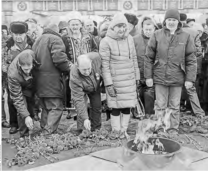
В этом году казанцы почтили память воинов-афганцев, возложив цветы к Вечному огню в парке Победы.

мятник воинам-интернационалистам установят на территории парка Победы. Но дело застопорилось. В мэрии сообщают, что проект обновленного монумента должна утвердить после обсуждения республиканская комиссия. В Министерстве культуры РТ говорят, что эскизы пока не представлены. Проволочка была обусловлена тем, что воины-афганцы и скульпторы не могли прийти к единому мнению, каким должен быть монумент. Сейчас спор разрешился. Планируется, что скульптурную композицию дополнят тремя статуями воинов и стелой, на которой будут указаны 39 фамилий воинов-афганцев. Установить памятник планируется до конца 2019 года неподалеку от Вечного огня в парке Победы. Но, как выяснилось, возможны и варианты. Точное место расположения монумента будет определять исполнительный комитет Казани. Александра Курбатова, Казань