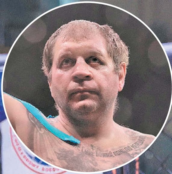
Союз ММА России

3 июня в Ханты-Мансийске завершился чемпионат страны по ММА, где определились чемпионы в 10 весовых категориях среди мужчин, а также в пяти – среди женщин.