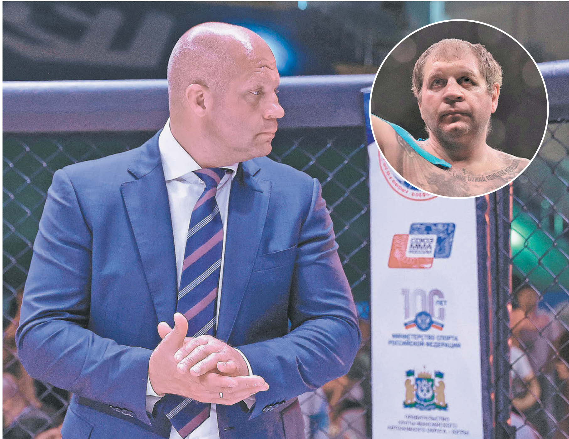
Федор Емельяненко и Александр Емельяненко (на правом снимке)

Обстоятельный разговор с легендарным бойцом, президентом Союза ММА России