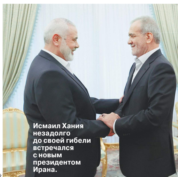
Исмаил Ханя незадолго до своей гибели встречался с новым президентом Ирана.