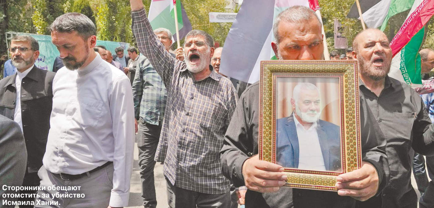
Сторонники обещают отомстить за убийство Исмаила Хани.

Как аукнется на Ближнем Востоке и в мире убийство политического лидера ХАМАС