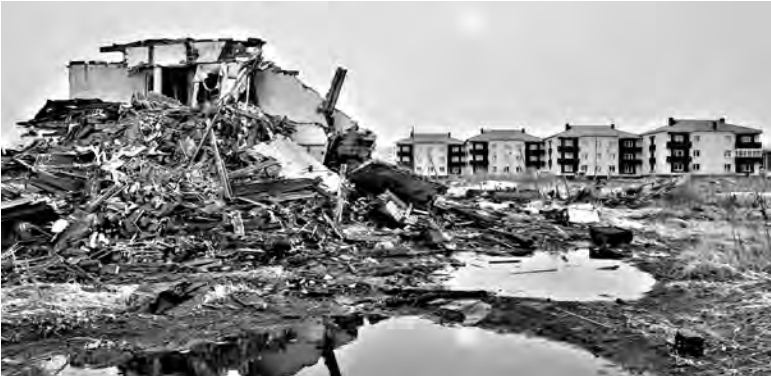
Пейзажи с развалинами снесенных баракы на фоне новостроек стали в Сахалинской области типичными.