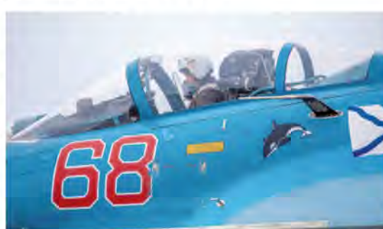
Ещё пару минут, и самолёт покажется на взлётную полосу.

- Но в любом случае, чтобы мы ни делали, всё выполняется с единой целью - получить допуск к несению боевого дежурства, чтобы личный состав полка был в полном объёме боеготов, способен выполнять задачи по