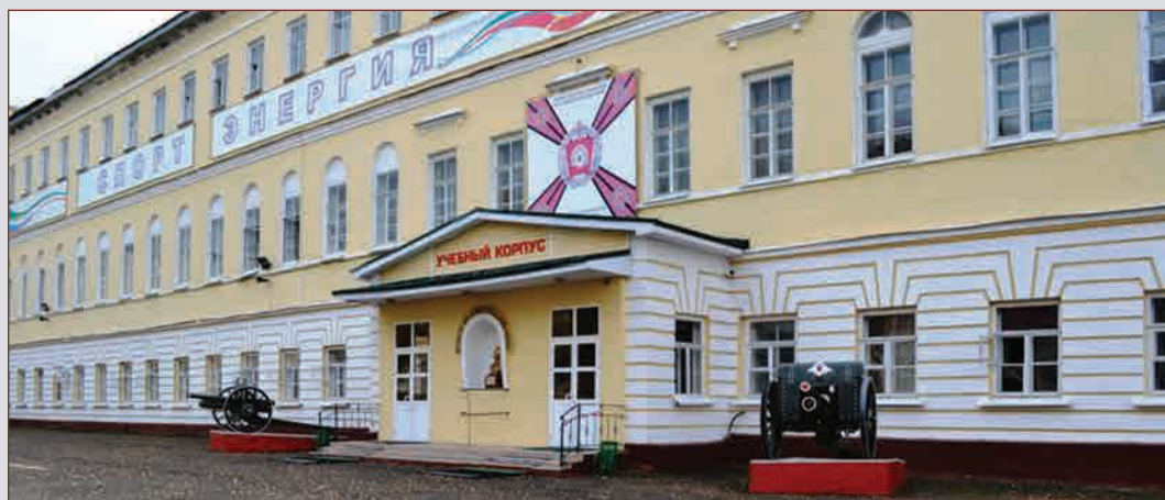
◀ ▲ Казанское СВУ ▼