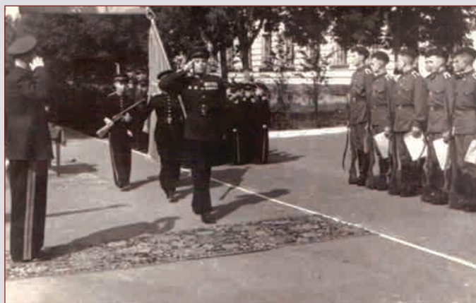
Страницы истории Казанского СВУ