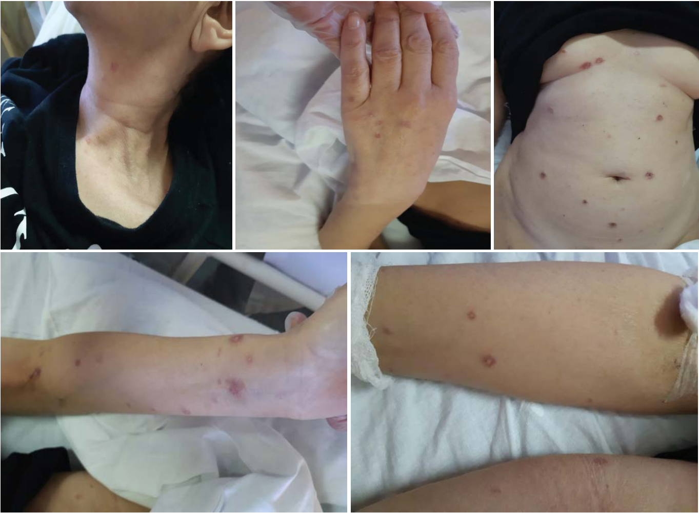
Рис. 1. Распространенные по телу оспенноподобные болезненные папулы с геморрагической корочкой в центре и багрово-красным ободком по периферии. В центре разрешившихся язвочек — атрофически западающие мраморно-белые рубчики Fig. 1. Spread over the body of smallpox-like painful papules with hemorrhagic crust in the center and purple-red rim on the periphery. In the center of resolved ulcers there are atrophic marble-white scars