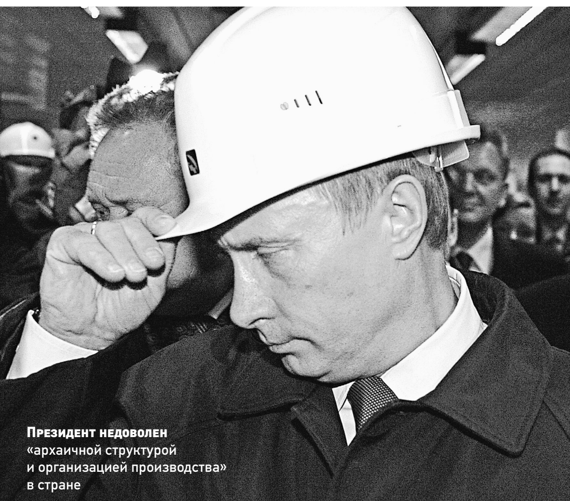
Президент недоволен «архаичной структурой и организацией производства» в стране

Владимир Путин предлагает создать принципиально новую модель промышленности