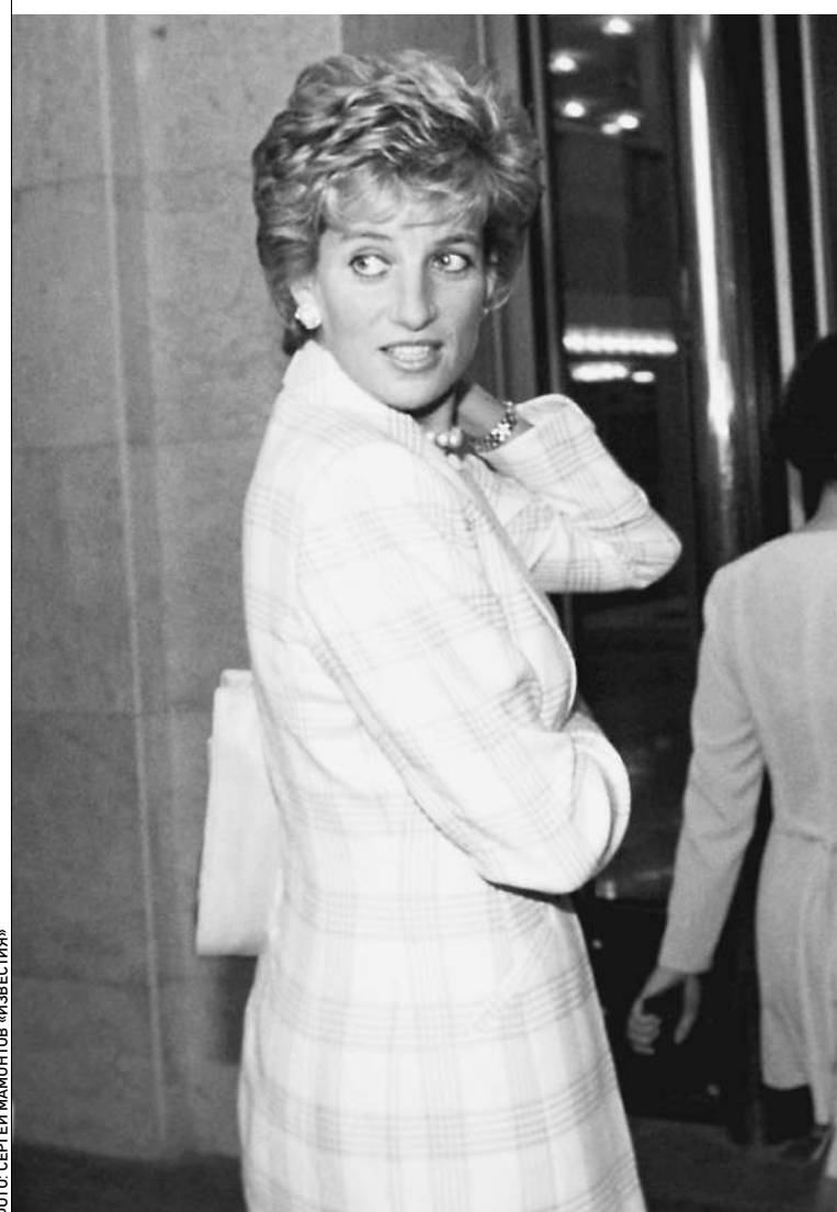
Москва, 9 июля 1995 года. ПРИНЦЕССА ДИАНА у входа в детскую кардиологическую больницу столицы