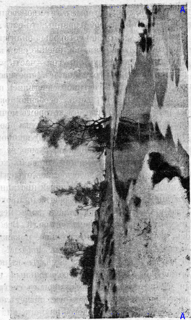
Е. М. Ендогуровъ. Начало весны.