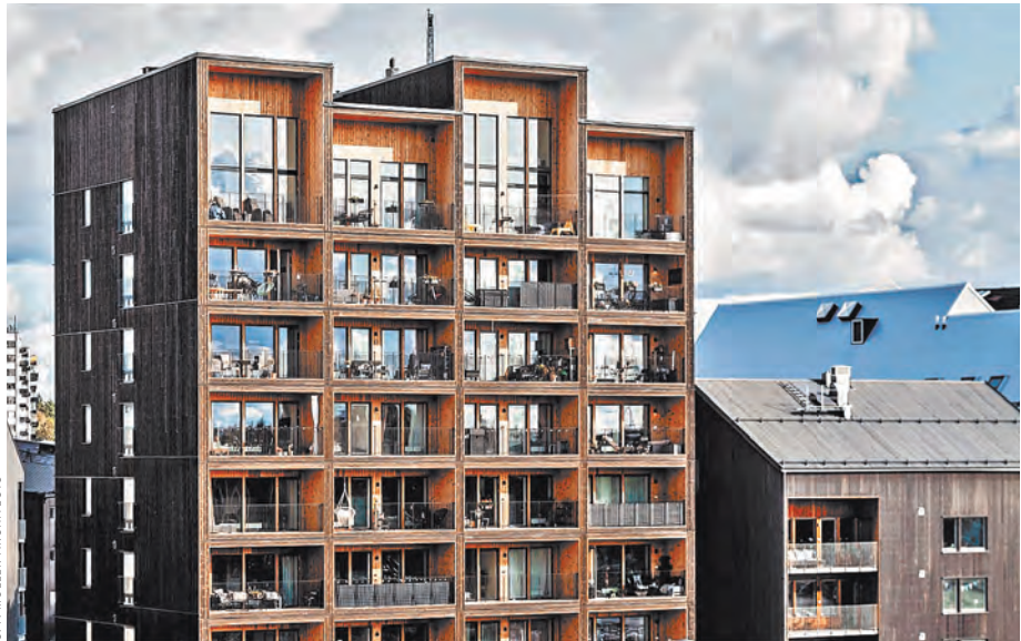
Деревянные многоэтажки есть уже во многих европейских странах.

ПРАВО Верховный суд: в каких случаях полицейского можно приглашать понятным