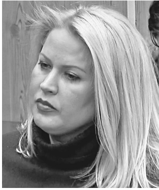
Павел Баранов / ИА «Стиль»