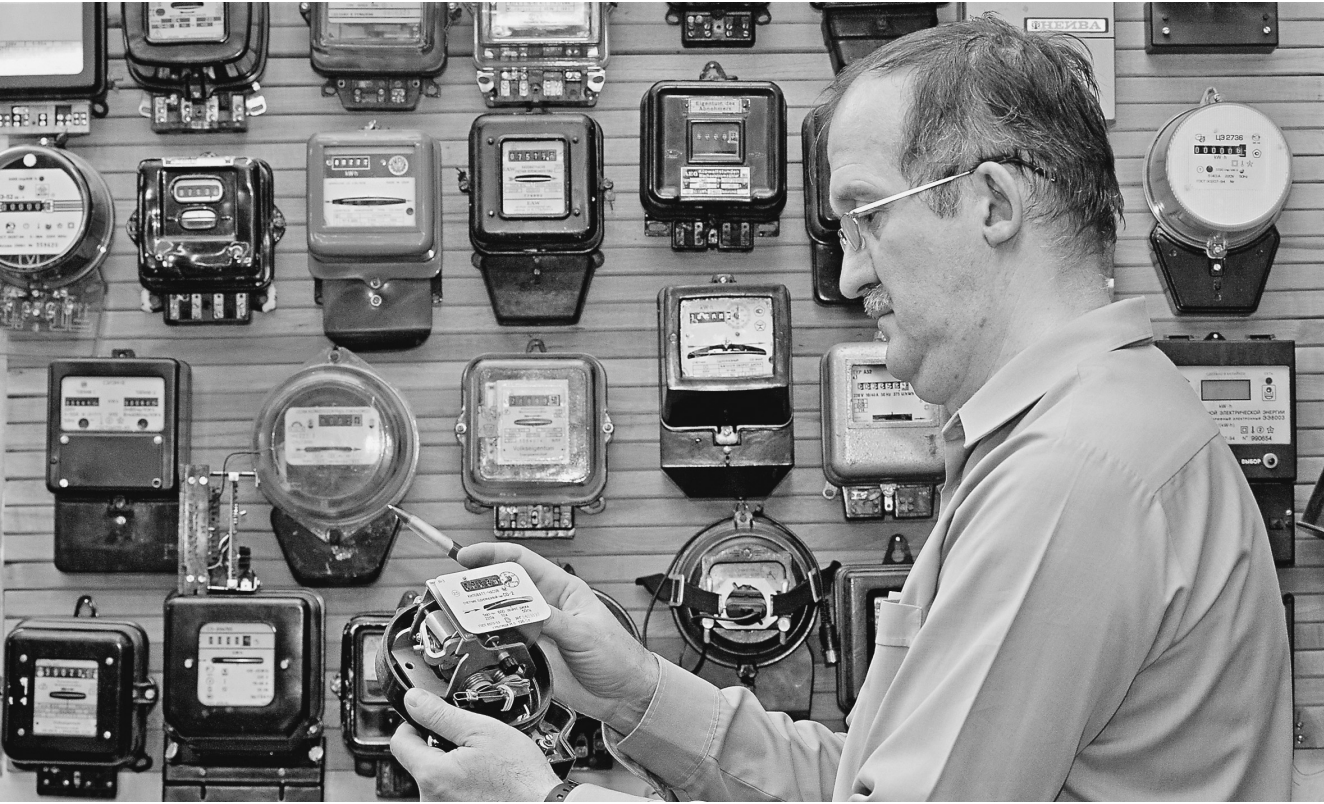
Поражают не показания счетчика, а суммы, которые по ним вычисляются