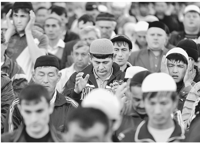
Ислам желает стать частью общественной дискуссии

— Наши федеральные каналы, когда мы проводим крупнейшие мероприятия международного плана, всероссийского, не приезжают, говорят, что скучно, — сетует зампред