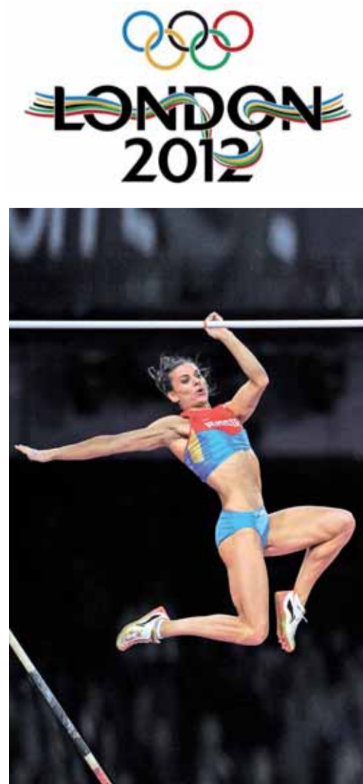
Елена Исинбаева. Только «бронза»...