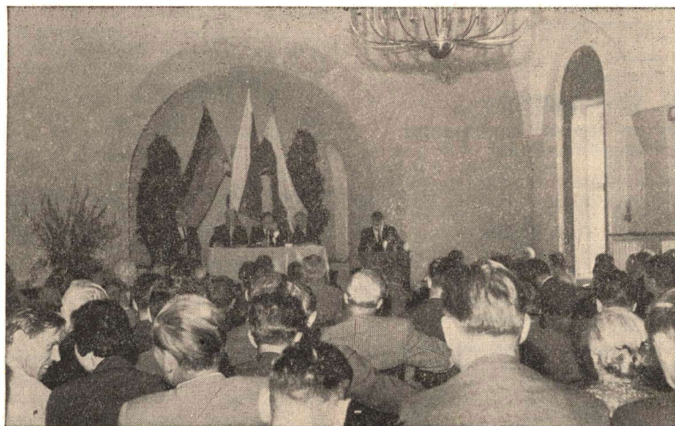
Этот двойной номер, в основном, содержит материалы X политической конференции «Посева», происходившей 16-18 сентября. На снимке: часть зала конференции.

5. Введение обучения в вузах без отрыва от производства в течение двух с лишним лет пагубно отразится на подготовке специалистов высшей квалификации. Готовя узких специалистов, не имеющих необходимой разносторонней гуманитарной подготовки, власть полагает, что они не будут ничем интересоваться, кроме своей профессии.