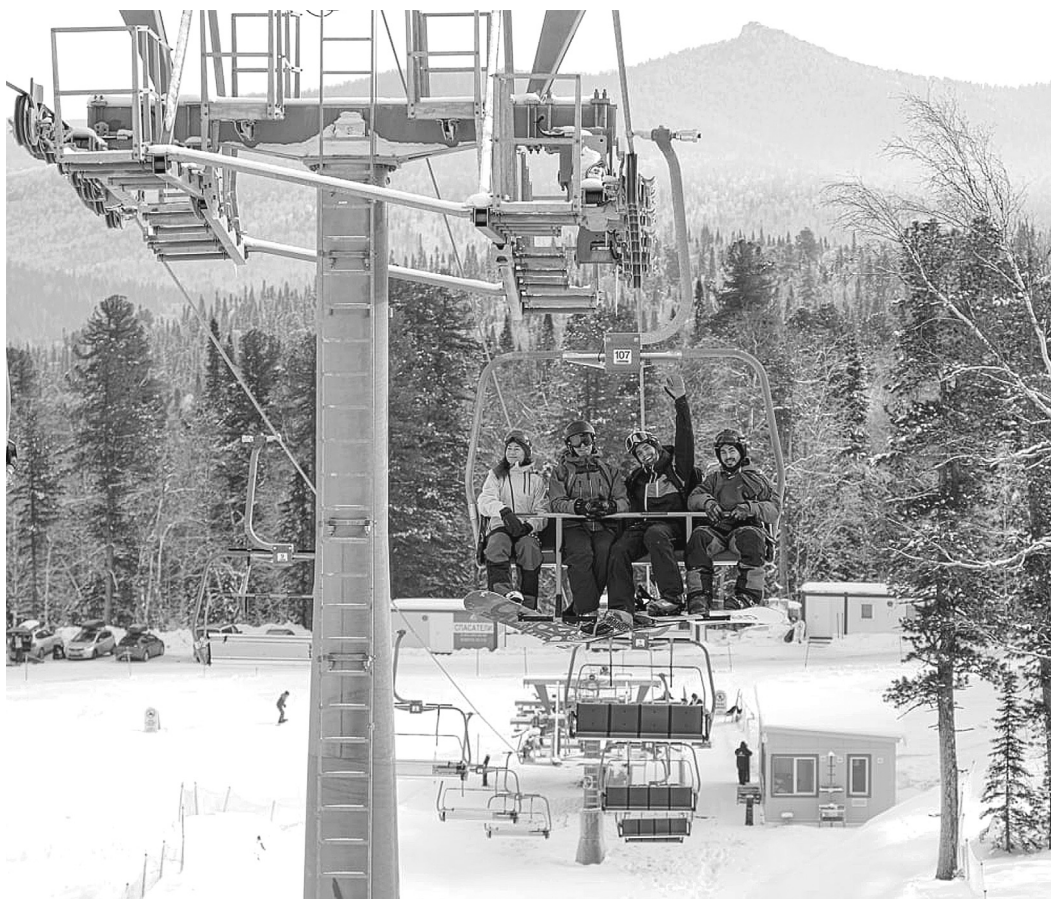
АДМИНИСТРАЦИЯ ПРАВИТЕЛЬСТВА КУЗБАССА