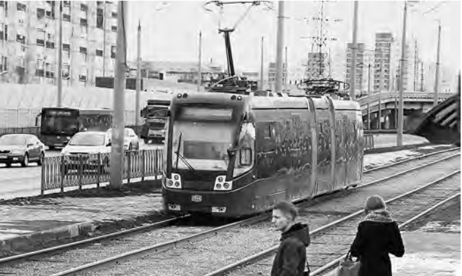
Пассажиры новых трамваев смогут воспользоваться Wi-Fi.

Новые вагоны будут комфортабельными, заказчик также требует, чтобы они были оснащены по последнему слову техники. К примеру, в салоне каждого вагона должен быть установлен Wi-Fi роутер с бесплатным интернетом, а в кабине вагоновожатого — видеорегистратор. Аналогичные камеры требуется установить и для наблюдения внутри салона. Там же разместятся мониторы с возможностью трансляции видеороликов в высоком разрешении, а в случае чрезвычайной ситуации — специальных инструкций. Также в трамвае должны стоять приборы контроля его местонахождения и действий водителя. Срок службы новых вагонов составит минимум 25 лет. СЕРГЕЙ ТАРАСОВ, Казань