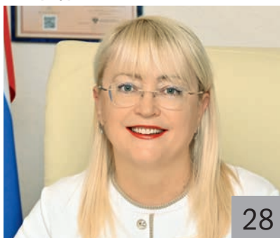
И. В. КИВИКО, заместитель председателя Совета министров Республики Крым — министр финансов