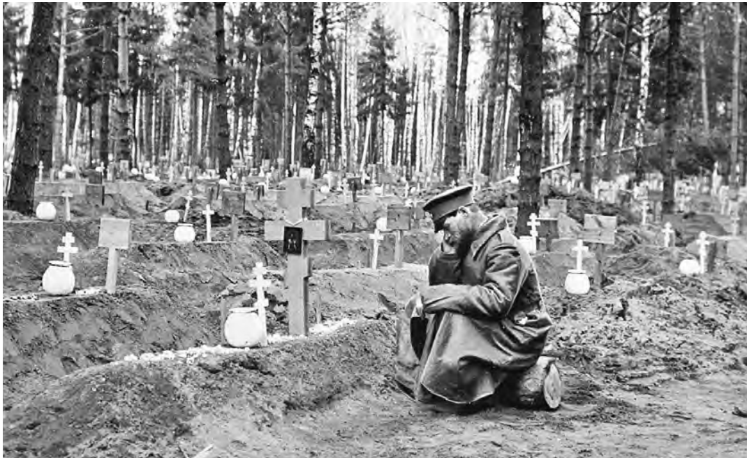
Солдат у могилы на братском кладбище погибших в Первой мировой войне.

1 августа исполняется сто лет со дня начала Первой мировой войны. После того как случается глобальная катастрофа, главным вопросом общественной дискуссии становится сакральный для русского сознания: «Кто виноват?» Ответить на него, если речь заходит, к примеру, о мировых войнах, очень сложно. Но кое-какие варианты объяснений у ученых все же есть. Тему санкций и наказаний в истории Первой и Второй мировых мы обсуждаем с директором Института всеобщей истории РАН, академиком Александром Чубарьном. Как известно Уинстон Черчилль считал, что одной из причин возникновения нацизма, а значит, и Второй мировой войны, было через чур жесткое наказание Германии после Первой мировой войны.