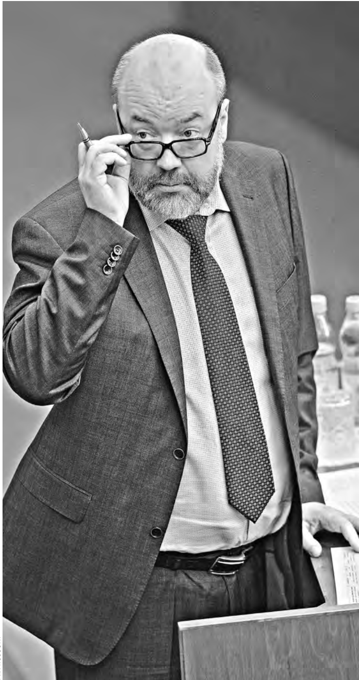
Павел Крашенинников: Поправки коснулись всех четырех частей Гражданского кодекса.

ИСТОРИЯ Санкции и наказания в мировой истории к добру не приводили