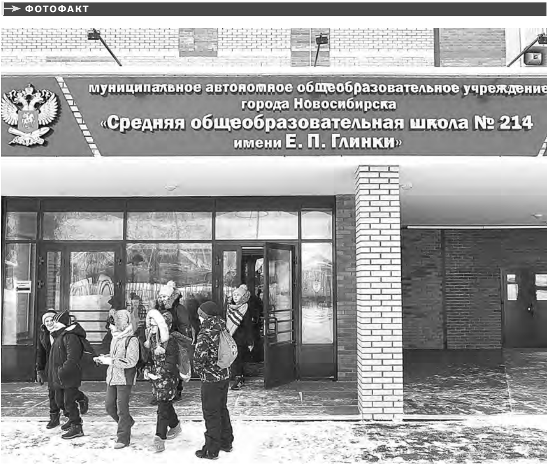
В Новосибирске на школе № 214 в Первомайском районе появилась новая вывеска. Учебное заведение назвали именем Доктора Лизы. Елизавета Глинка погибла в декабре 2016 года во время авиакатастрофы Ту-154, когда самолет упал в море после вылета из Сочи. Она была главой фонда «Справедливая помощь» и сопровождала гуманитарный груз в Сирию.

В ДЕРЕВНЕ Хапово Здвинского района Новосибирской области, где проживает 238 человек, запустили в эксплуатацию водозаборную скважину глубиной 750 метров и станцию очистки воды. Теперь проблем с качественной питьевой водой здесь больше не будет, затраты областного бюджета на их решение составили 21,8 миллиона рублей. Всего в 2019 году в регионе планируют запустить в работу 21 водозаборную скважину.