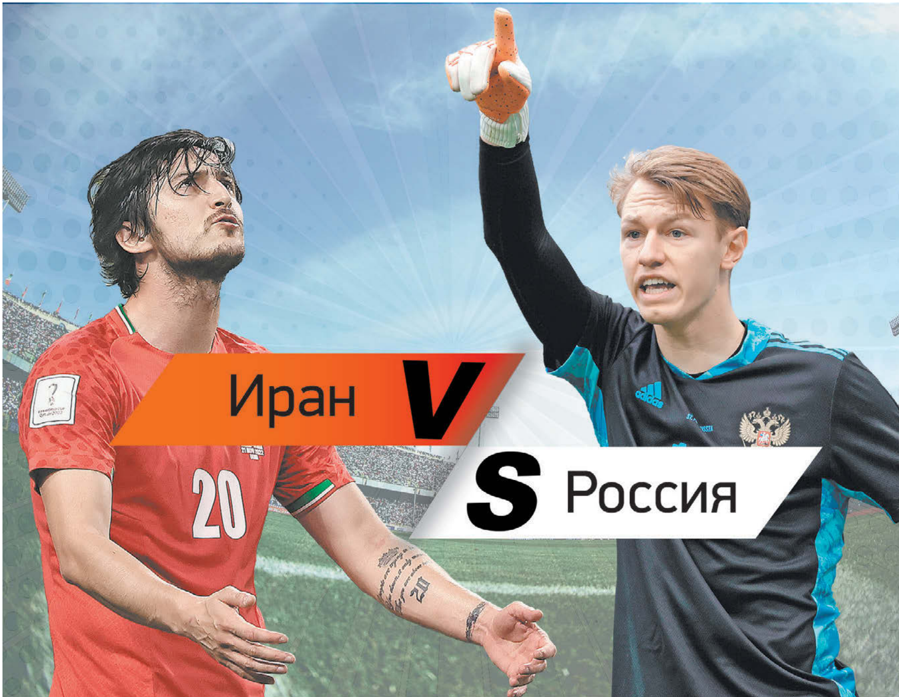
Нападающий сборной Ирана Сердар Азмун

Вчера тегеранское издание Tasnim сообщило, что 22 или 23 марта этого года Россия проведет товарищеский матч с Ираном