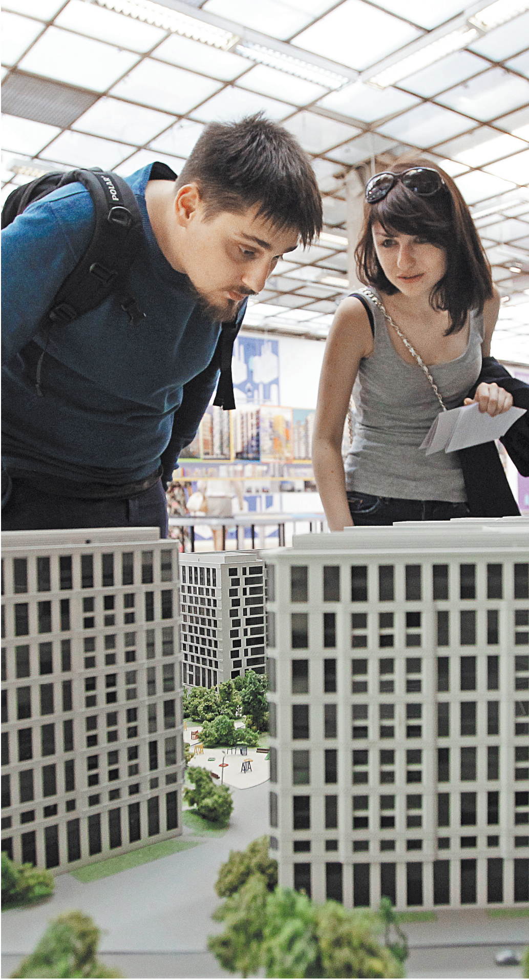
В России сдается 9 процентов квартир, в развитых странах доходит и до 40 процентов.

нас уже есть запущенные проекты в ряде субъектов страны, мы планируем расширить присутствие. Ведь этот блок регионального развития очень важен для нас как для института развития. Поэтому активно вовлекаем в процесс подготовки заявок региональных девелоперов, ведем переговоры с главами субъектов, консультируем администрации городов», — рассказывал ранее Мутко. Уже существует 13 реализованных проектов в пяти регионах. До конца 2020-го на рынок выйдет еще три новых арендных дома в Москве: «Парк Легенд», «Октябрьское поле», «Матч поинт», а также один дом «Современник» в Воронеже. Сейчас «ДОМ.РФ» рассматривает строительство новых арендных домов в 15 регионах. Развитие программы арендного жилья реализуется через механизм коллективных инвестиций, а именно закрытых паевых инвестиционных фондов, когда в программу привлекаются средства частных инвесторов. «ДОМ.РФ» помогает застройщикам приобретать через аукционы земельные участки, а за это получает часть квартир под арендное жилье.