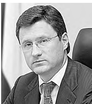
Александр Новак, заместитель председателя правительства РФ: