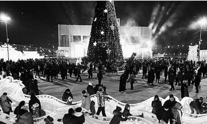
В Рождество на эспланаде собралось народу не меньше, чем в Новый год, — тоже порядка 40 тысяч человек.