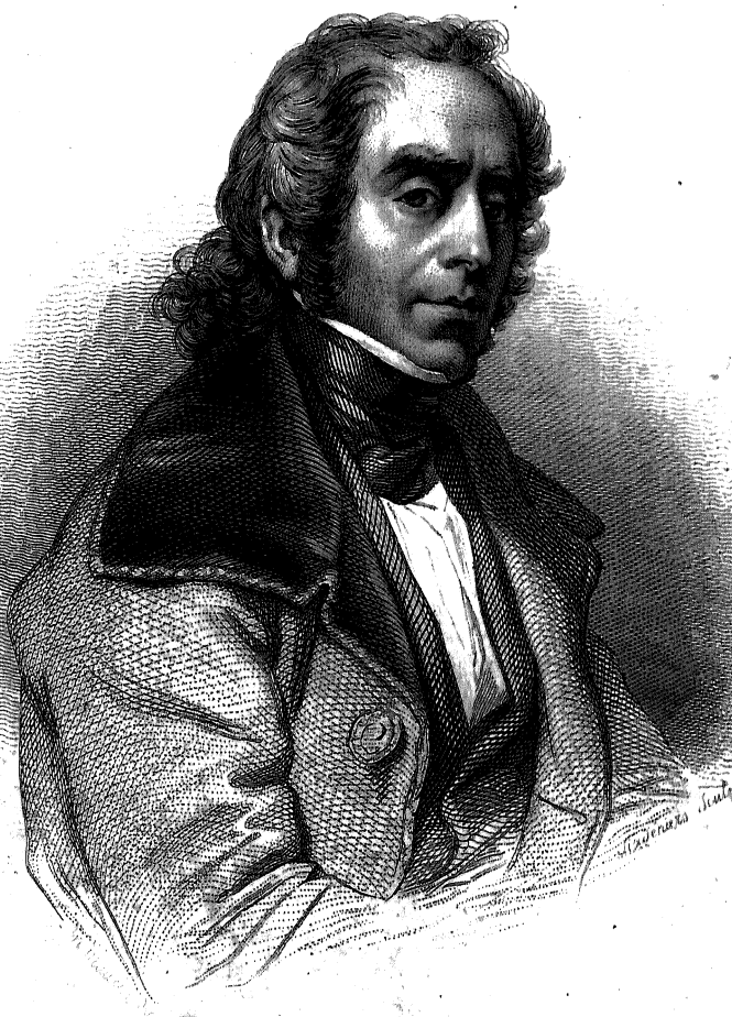
JACQUES ARAGO .

Ton nom est un reflet du grand nom de ton frère ; A vous, François, les cieux, à toi, Jacques, la terre .