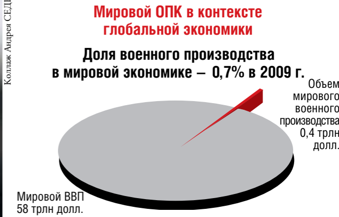
Коллаж Андрея СЕДУХА

Несмотря на колоссальные военные расходы США и выглядящие внушительно оборонные бюджеты других западных стран, долгосрочные перспективы оборонных компаний Запада кажутся не столь уж оптимистичны-