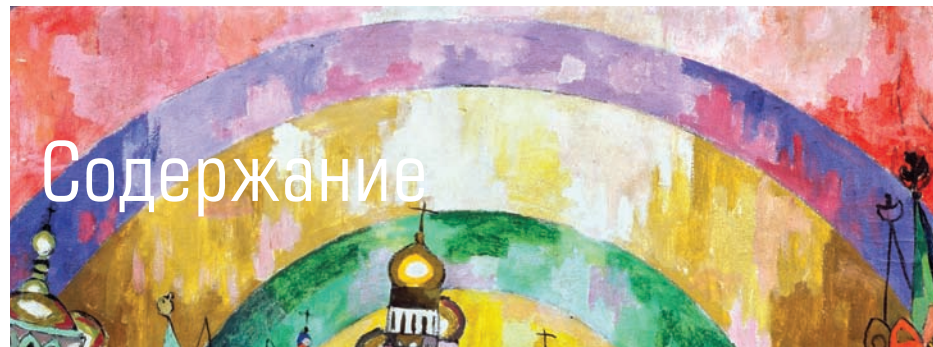
НА ОБЛОЖКЕ ЖИВОПИСЬ АРИСТАРХА ЛЕНУЛОВА