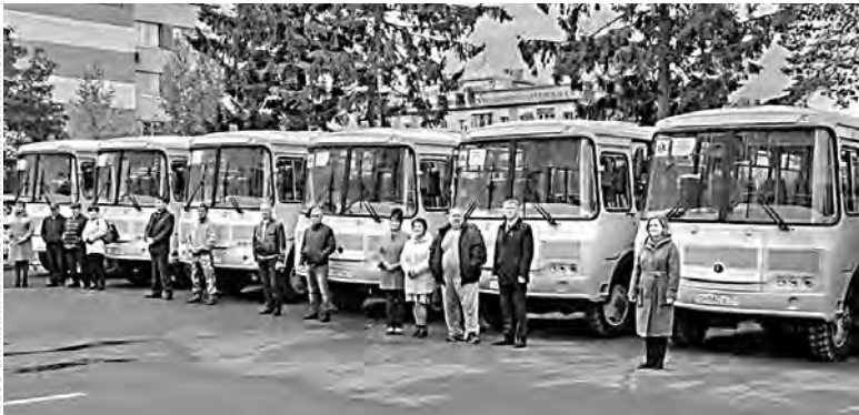
Теперь сахалинские школьники отправятся за «пятерками» на новых автобусах.

Школьные автобусы перевозят свыше трех тысяч сахалинских и курильских учеников по 112 маршрутам.