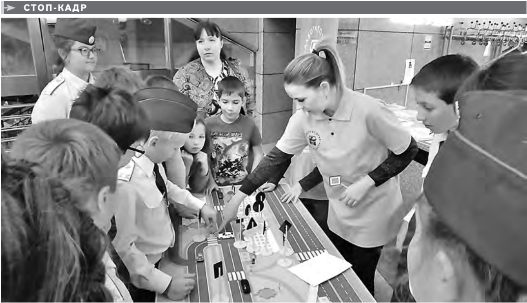
В Благовещенске появился центр по профилактике травматизма детей на дорогах «Лаборатория безопасности». Его открыли в рамках реализации соответствующего федерального проекта. Лаборатория представляет собой автобус с оборудованием: велосипедами, самокатами, столами-макетами и другим. Все это позволит смоделировать различные ситуации на дорогах и научить детей правильному поведению.

СОГЛАШЕНИЕ о его внедрении подписали краевой минздрав, Агентство стратегических инициатив, благотворительные фонды «Вера» и «Детский паллиатив». Теперь родственники смогут навещать детей, оказавшихся в реанимации и отделениях интенсивной терапии. Чтобы не нарушать лечебный процесс, уже разработаны правила посещения. Камчатский край стал пятым субъектом РФ, присоединившимся к проекту.