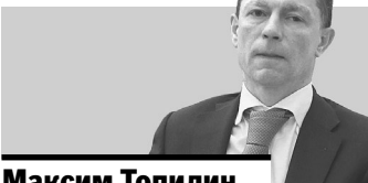
Максим Топилин, министр труда и социальной защиты РФ