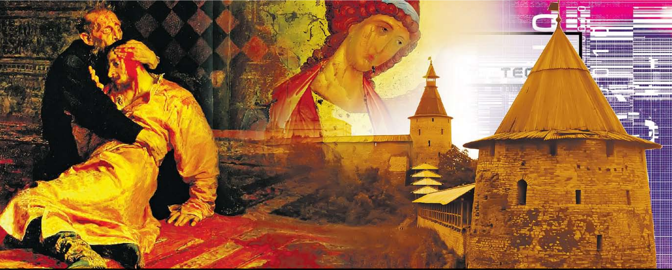
Коллаж Андрея СЕДУХ

Думаю, после всего того, что мы пережили, у нас есть шанс или стать пусть не великой, но все же западной страной, с развитым и ответственным гражданским обществом, или, отгородившись от Запада, попытаться в какой уж раз создать на путях имитационной модернизации мощное государство, но со стремительно дикушащим народом, поработанным безнравственной элитой, — колосса на глиняных ногах, рано или поздно обреченного на обрушение. Из этой альтернативы, на мой взгляд, есть только один выход — открыть себя Западу, примириться с тем, что сейчас мы не можем быть первыми (слишком много лучших жизней унес у нас XX век), и на тех роплях, какие еще мы можем заслужить, войти в концерт западных держав. Другого пути, достойного нашего многострадального народа, у России как не было, так и нет.