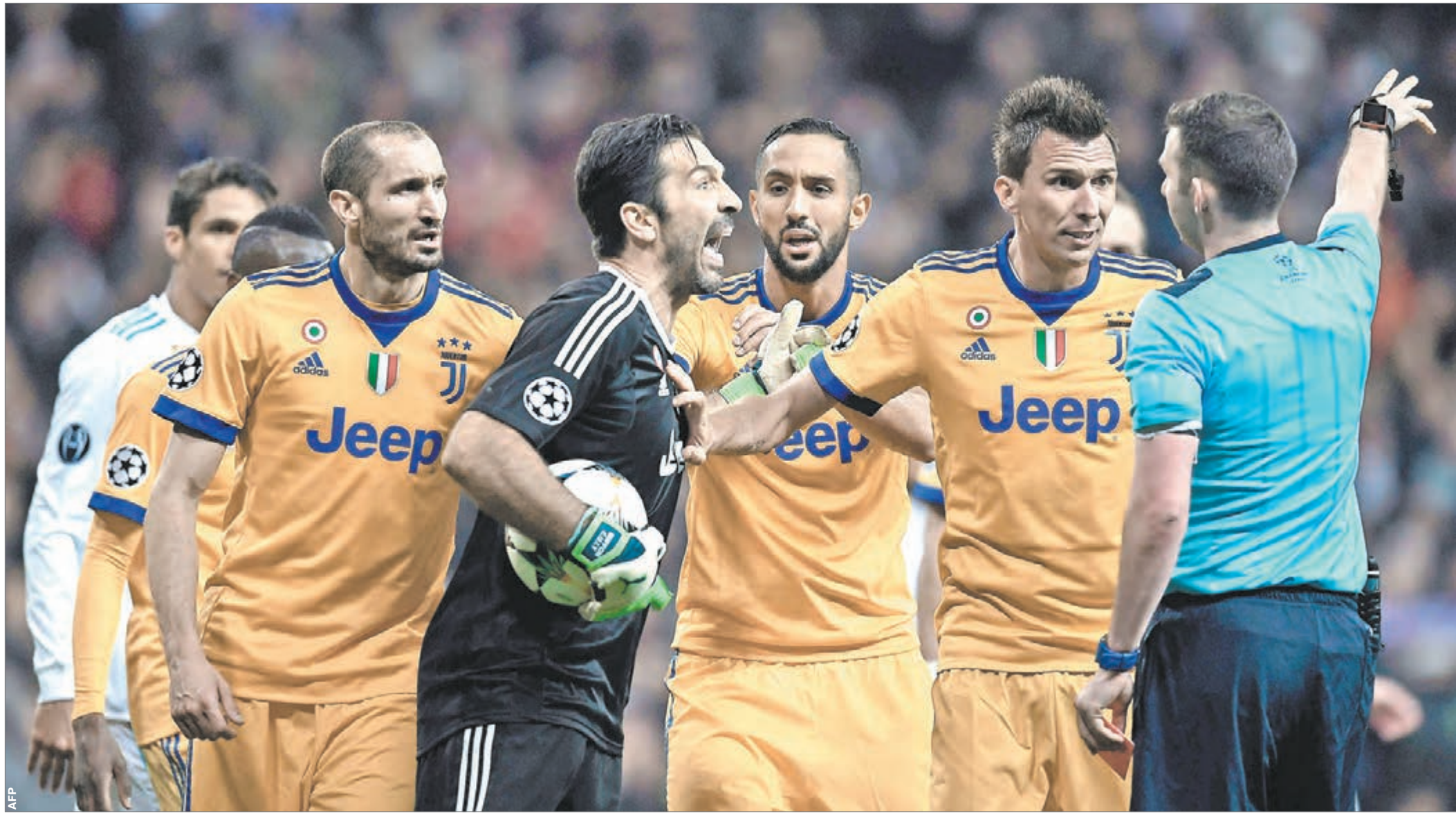
Вчера. Мадрид. «Реал» - «Ювентус» - 1:3. 90+3-я минута. Через мгновение арбитр Майкл ОЛИВЕР (справа) удалит вратаря Джанлуиджи БУФФОНА (в центре).

Эпическая развязка четвертьфинала Лиги чемпионов - «Ювентус» смог отыграть три мяча у «Реала», но в компенсированное время вылетел из-за спорных решений английского арбитра Майкла Оливера: пенальти и удаления Джанлуиджи Буффона