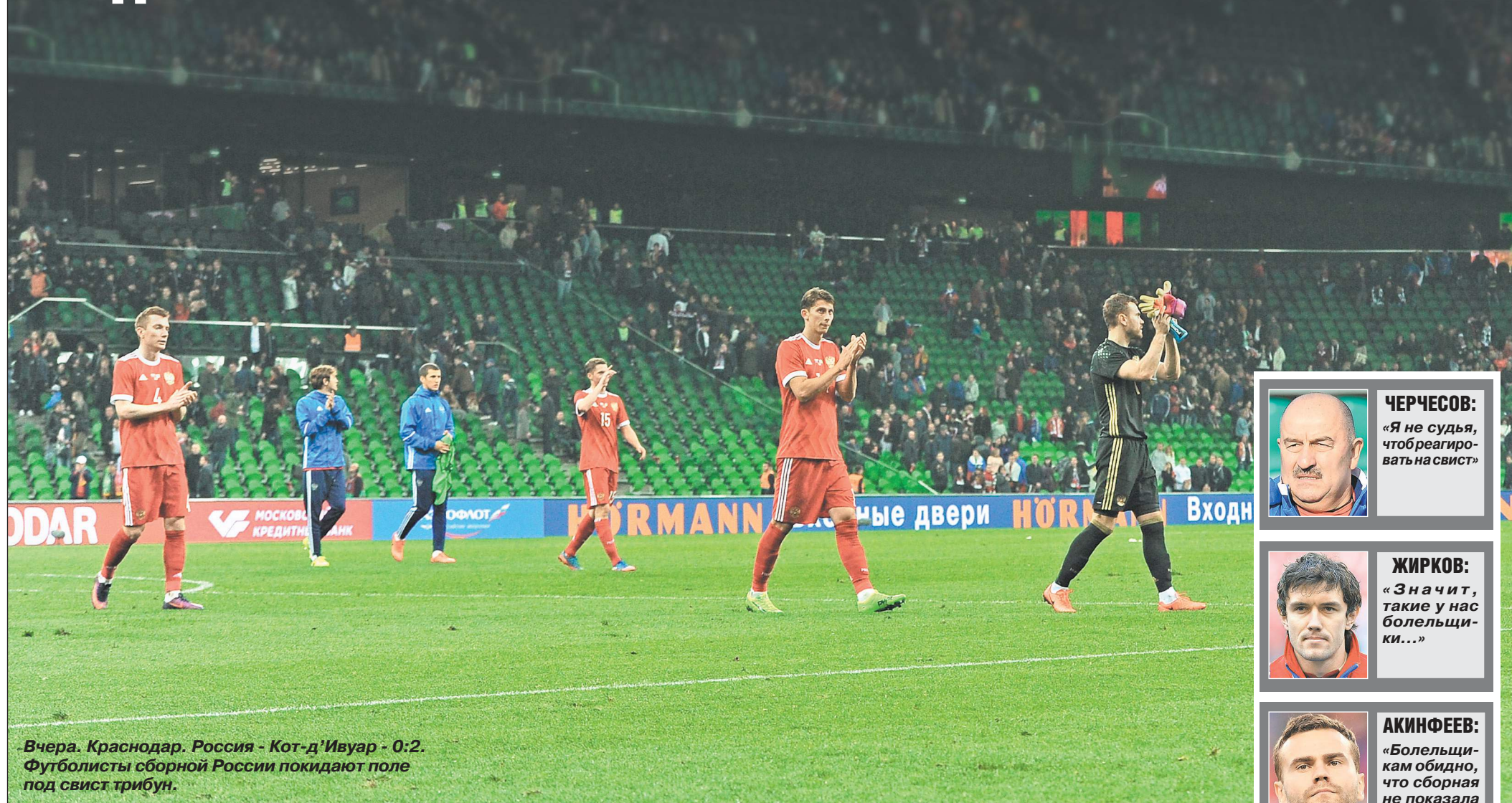
Вчера. Краснодар. Россия - Кот-д'Ивуар - 0:2. Футболисты сборной России покидают поле под свист трибун.

ТОЛЬКО НЕ ПОДУМАЙТЕ - ЭТО НЕ ПРО НАШИХ. ТАК РОССИЙСКИЕ БОЛЕЛЬЩИКИ КРИЧАЛИ АФРИКАНЦАМ. А ДЛЯ СБОРНОЙ РОССИИ ПРИЛИЧНЫХ СЛОВ У НАС НЕТ.