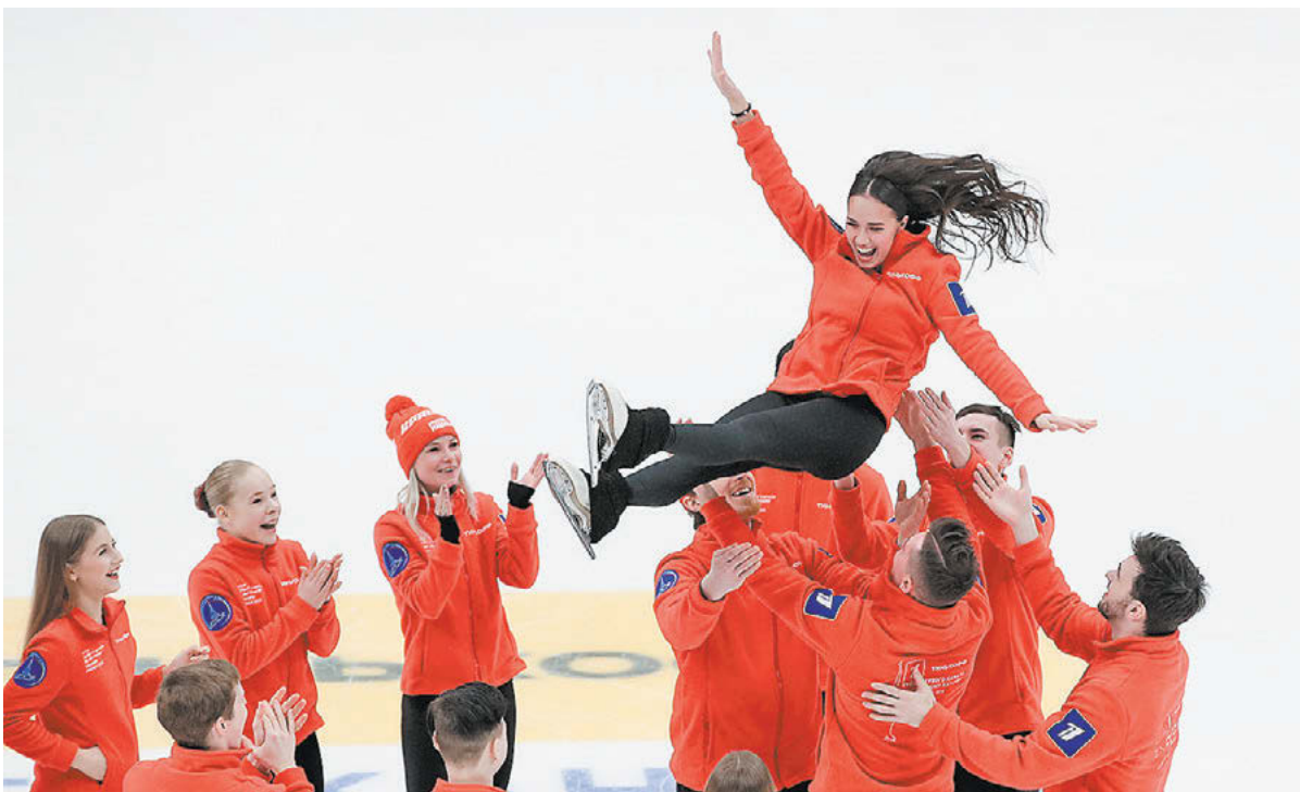
Команда «Красная машина» качает своего капитана Алину Загитову