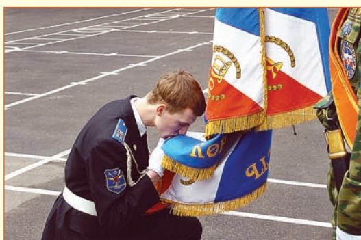
▲ «Святее знамени лишь мать, стремись всю жизнь их защищать». Прощание со знаменем во 2-м московском кадетском корпусе МЧС