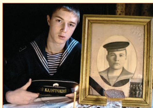
▲ «Чрез поколения чтить и продолжать традиции отцов и дедов. Памяти деда буду достоин». Московский объединенный морской кадетский корпус героев Севастополя. 2006 г.