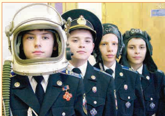
▲ «Служим России». 2-й московский кадетский корпус

Фото преподавателя А.Ю. ГАЛИНИНА, 29 лет