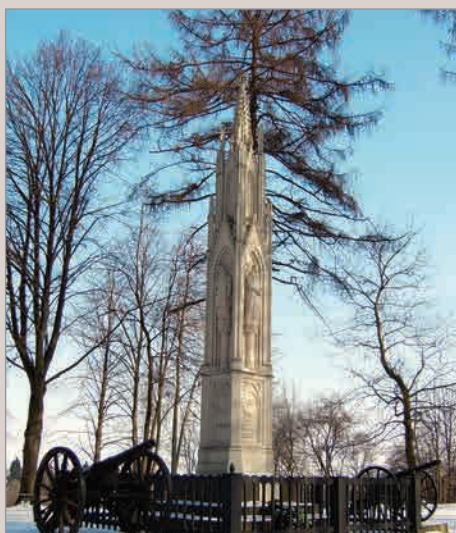
Памятник 1856 года Архитектор А. ШТЮЛЛЕР