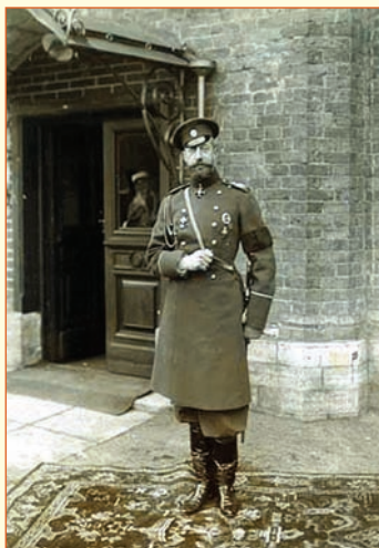
Великий князь Константин Константинович во время посещения Педагогических курсов для офицеров-воспитателей кадетских корпусов в Санкт-Петербурге. 1913 г.

Публикацию подготовили Ю.С. ВЕРЕЩАГИНА; Д.А. НУРЕЕВА, студентки Московского гуманитарно- экономического института