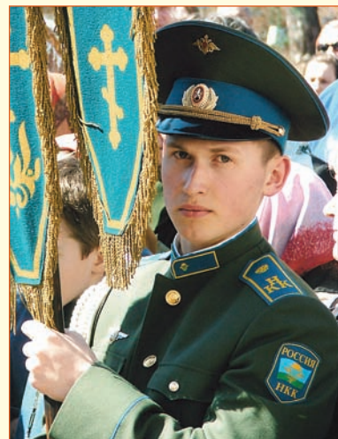
«Крестный ход во время праздника Святой Пасхи». Нижегородская кадетская школа-интернат имени генерала армии Маргелова. 2006 г.