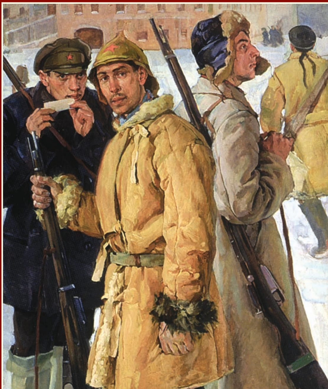
Первые красноармейцы в 1918 г. Фрагмент картины художника И.Г. ДРОЗДОВА

23 февраля — День защитника Отечества В 1922—1993 гг. отмечался как День Советской армии и Военно-морского флота. День воинской славы России