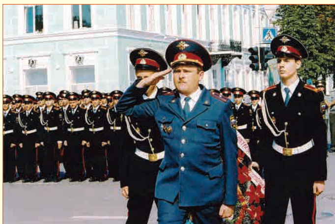
▲ «Оказана честь почтить память героев Великой Отечественной войны». Новочеркасское суворовское военное училище МВД России. 2004 г.