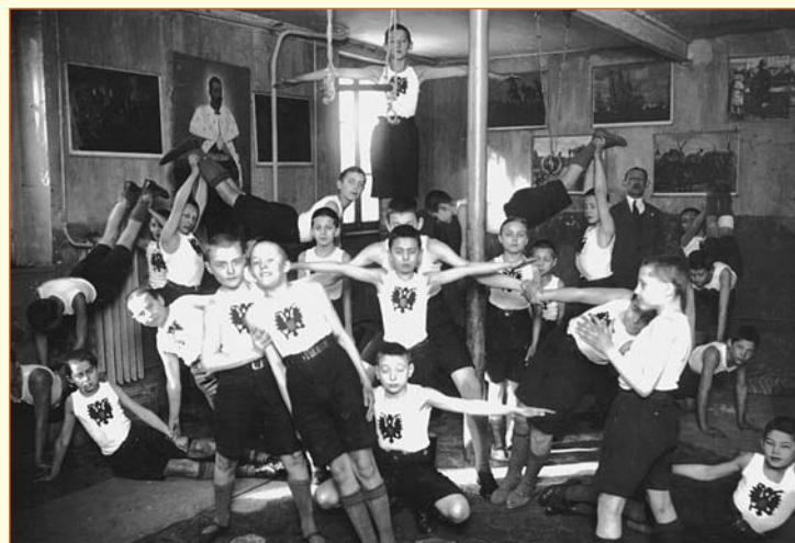
▲ На занятиях по гимнастике в Корпусе-лицее императора Николая II в Версале. 1933 г.