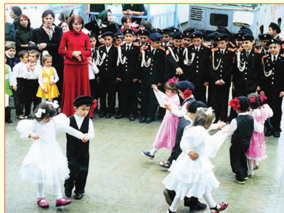
«Танец на бис». Дербентский кадетский корпус. Выступление юных танцоров после принятия кадетами торжественного обещания. 2005 г.