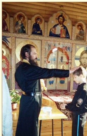
«Благословение». Улан-удэнский кадетский корпус Фото И. АРЕФЬЕВА, 11 лет

Фото директора музея кадетского корпуса А.В. ВИХАРЕВА, 24 года