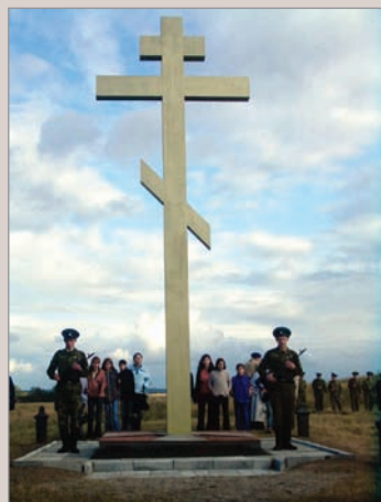
Памятный знак «Русскому воинству 1807 года»