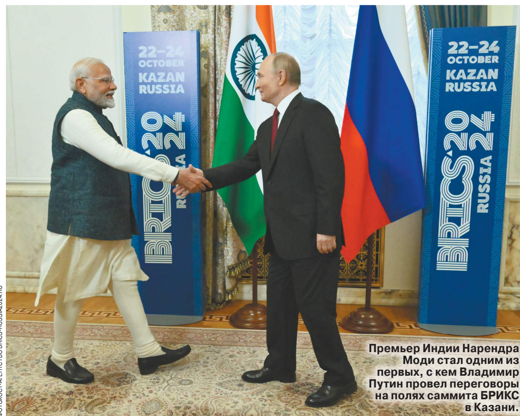
Премьер Индии Нарендра Моди стал одним из первых, с кем Владимир Путин провел переговоры на полях саммита БРИКС в Казани.