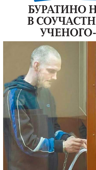
Сыновья убитого гидролога

Точку в деле о серии жестоких убийств, прокатившихся по Москве летом 2002 года, поставил Бабушкинский суд столицы. Жуткие преступления вызвали повышенный интерес еще и потому, что в ходе следствия разразился скандал: в соучастии в убийствах безосновательно обвинили известного ученого-гидролога Александра Цветкова.