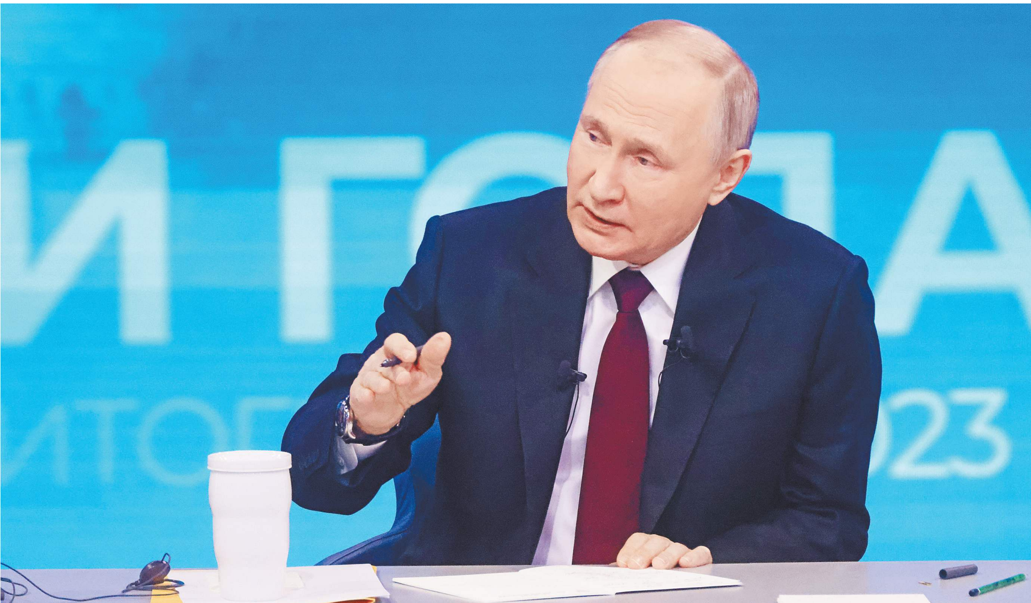
Владимир Путин ответил на 67 вопросов журналистов, которые были в зале, и граждан России из самых разных регионов.

Самый главный показатель роста экономики — рост валового внутреннего продукта по концу года ожидается 3,5 процента. Это хороший показатель, это значит, что мы отыграли падение прошлого года, там у нас было, по-моему, 2,1 процента. Если в этом году будет плюс 3,5 — значит, отыграли падение и сделали достаточно серьезный шаг вперед.